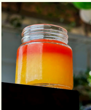
Energy & Clarity

Manzana verde, limón, pimienta Cayena, Maple Syrup orgánico, jengibre, aceite esencial de orégano y aceite esencial On Guard.